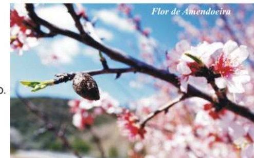
Flor de Amendoeira

Caso esteja a realizar o percurso nos meses de Janeiro/ Fevereiro ficará maravilhado com as amendoeiras em flor, que, todos os anos por esta altura, Cobrem a paisagem de branco.