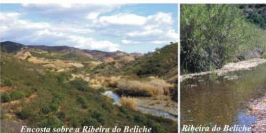
Encosta sobre a Ribeira do Beliche